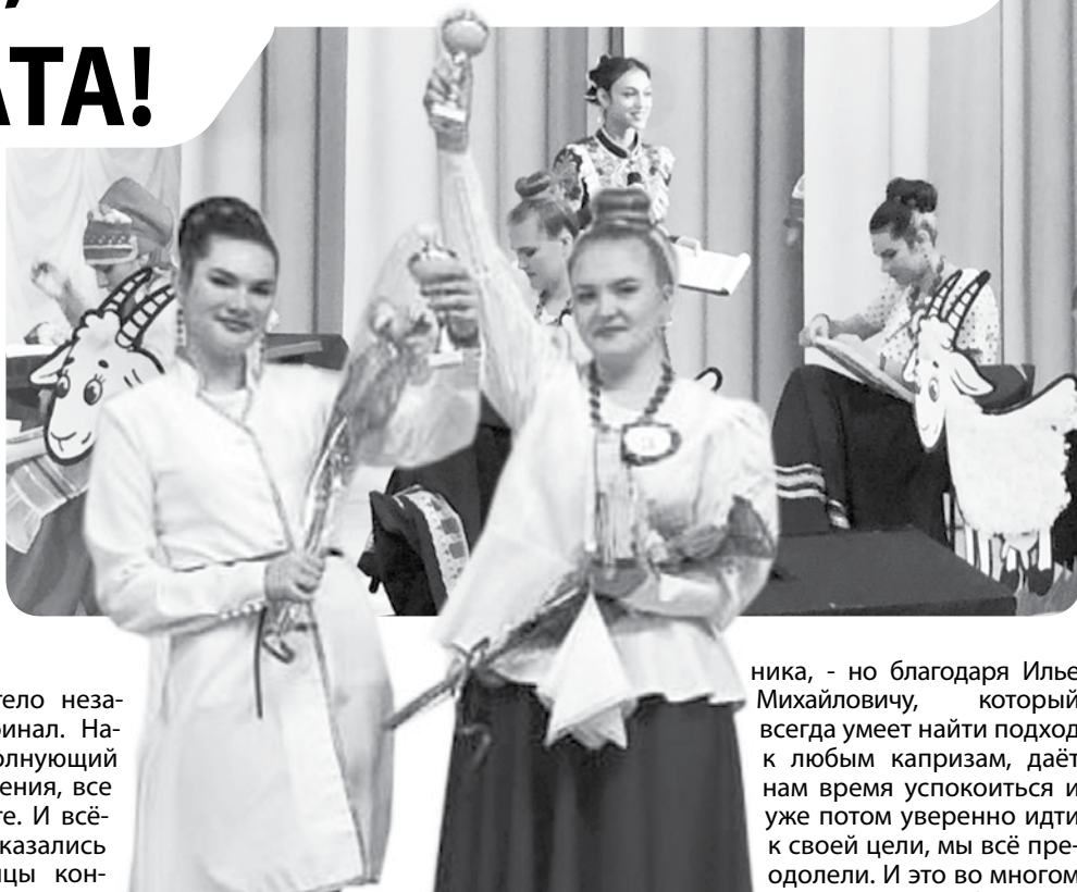
Во время вручения наград.

После праздника мне удалось пообщаться с девушками и их руко-