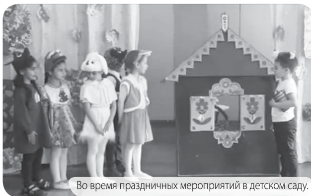
Во время праздничных мероприятий в детском саду.

Развлекательные мероприятия в детском саду проводятся по времени года и приносят малышам много положительных эмоций, на них дети могут проявлять свои творческие способности, выразить себя, отметить способности других детей, закрепить полученные ранее знания, расширить кругозор.