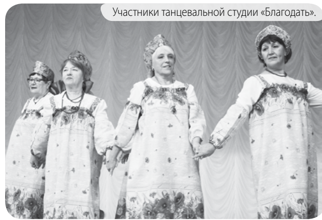
Участники танцевальной студии «Благодать».

Декабрь - время подводить итоги, и наши танцоры с вдохновением готовятся к отчётному концерту, который пройдёт 19 декабря в 14.00 в Центре досуга и творчества «Предгорье». Все участники концерта подходят к мероприятию очень ответственно. На одном дыхании провели обязательную генеральную репетицию.