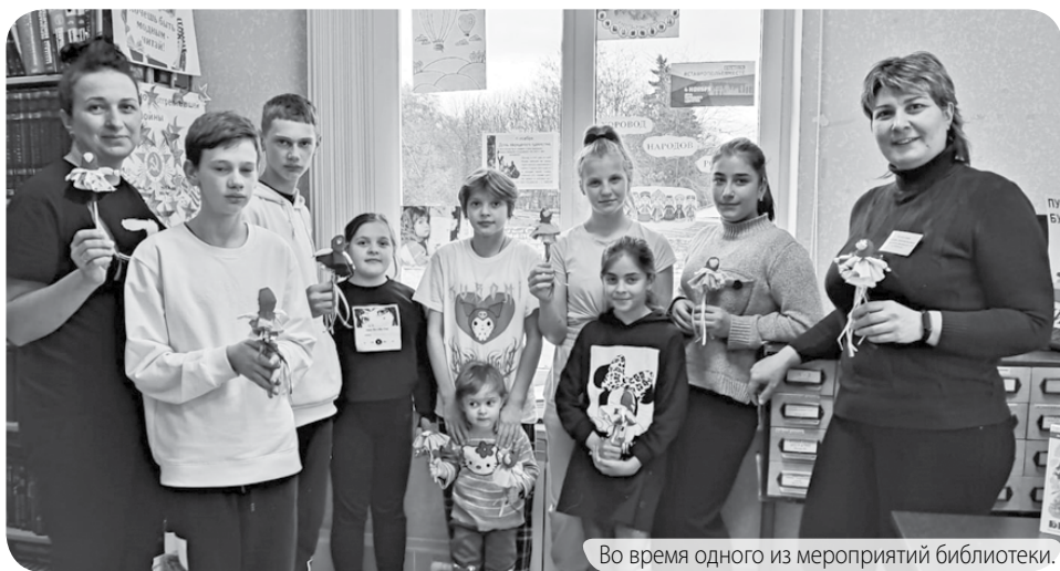
Во время одного из мероприятий библиотеки.

Неделя детской книги прошла интересно, познавательно, весело! Для маленьких читателей проведена познавательно-развлекательная программа «Славянский калейдоскоп детских