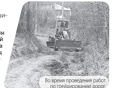
Во время проведения работ по грейдированию дорог.

Анастасия ПРОКОФЬЕВА.