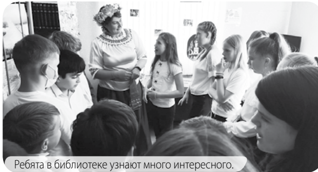
Ребята в библиотеке узнают много интересного.

Пространство библиотеки и Дома культуры было разбито на фольклорные зоны, где детей встретили сказочные персонажи. В этот день мы проверили знания ребят по рус-